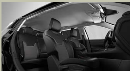
Sedadla čalouněná v kombinaci černé látky a vinylu s šedým prošíváním (Altitude 020)