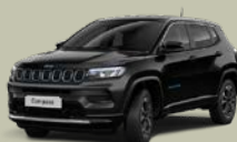
Černá Solid (5CK-601)