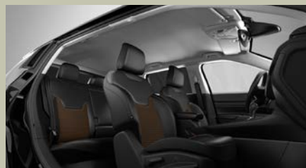
Sedadla čalouněná v kombinaci látky a vinylu s bronzovým nádechem a prošíváním (Overland 952)