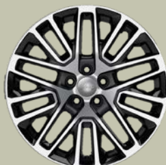
19" disky z lehkých slitin Summit (3DP)