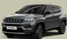
Šedá Graphite + černá střecha (5EZ-170)