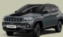
Šedá Sting + černá střecha (0Q1-264)