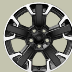
17" disky z lehkých slitin Overland & Trailhawk (1M4)