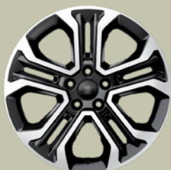
18" disky z lehkých slitin Altitude (3DM)